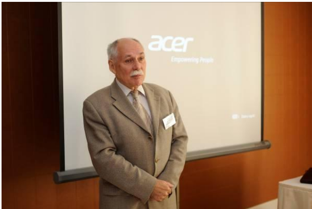
Obr.26: Bedřich Moldan, Místopředseda, Rada vlády pro udržitelný rozvoj;